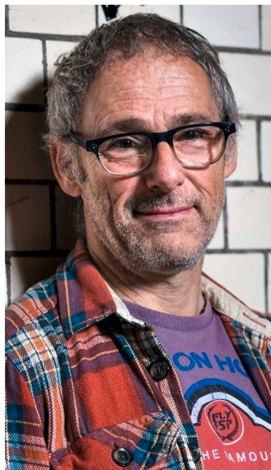
Daniel Levy: Schweizer Schauspieler, Drehbuchautor und Regisseur.

Wenn plötzlich ein Känguru an die Tür klopft ... Mit dieser absurden Eröffnungsszene im Film « Die Känguru-Chroniken » landete der Schweizer Regisseur Dani Levy (Bild) einen Kinohit. Die Satire mit dem computeranimierten Känguru ist am 5. März in den Kinos angelaufen und seither auf Platz eins der deutschen Kinocharts. Rund 3 Millionen Franken spielte der Film kurz nach seinem Anlaufen bereits ein, 375 000 Besucher kamen am Startwochenende. Die Produktion ist deutsch, die Regie führte der als « Peperoni » bekannt gewordene gebürtige Basler Daniel Levy. Der Kultregisseur legte eine Karriere vom Clown und Akrobaten