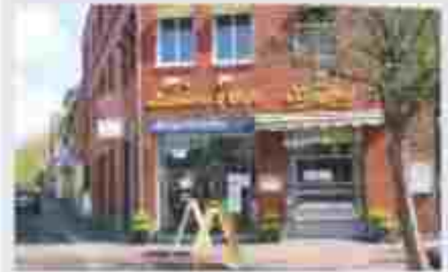
Die Elmshorner Stadtbackerei Sedemund eröffnet am 1. Februar ihre neue Filiale im ehemaligen Café Klingbeil.

Glückstadt/Elmshorn (rs) Das ist eine richtig gute Nachricht für Glückstadt. Nach längerem Leerstand übernimmt das Elmshorner Traditionsunternehmen Sedemund das ehemalige Café Klingbeil am Markt 7.