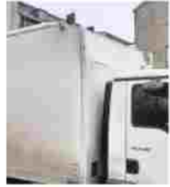
Der Transporter wurde am Dach beschädigt.

Elmshorn (Hf) Schon wieder hat es im Geschwister-Scholl-Tunnel gekracht. Ein Transporter prallte am Montag gegen 8.50 Uhr gegen das Bauwerk, teilte Hartspeter Schwartz, Sprecher der Bundespolizei, mit. Das Fahrzeug war für die Bahnunterführung zu hoch. Ein abgehängtes Brett soll zwar als Höhenwarnsystem dienen. Doch es hielt den 26-jährigen Fahrer nicht auf, den zu hohen Transporter in die Unterführung zu steuern. Der Wagen wurde stark beschädigt. Der Fahrer konnte ihn aber zurücksetzen. Die drei Gleise über dem Tunnel wurden für etwa eine