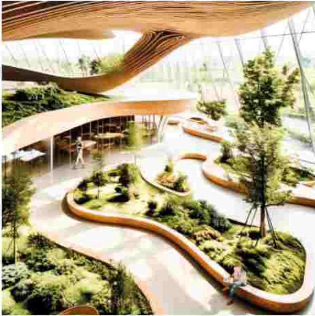
Das Vivaneum ist als Naturerlebnis-Haus mit großen Glasfassaden geplant.