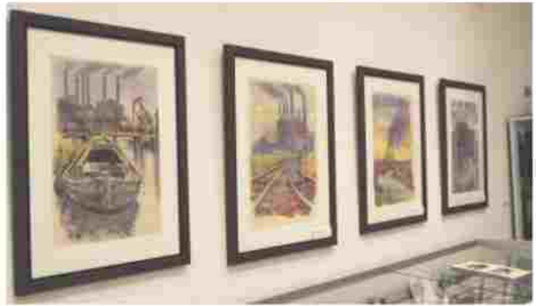
In seiner Zeit in Hohenfelde malte Hermann Degkwitz auch zahlreiche Aquarelle, die heute dem Heimatmuseum Lägerdorf gehören. Viele von ihnen zeigen die ehemalige „Breitenburger Portland-Cementfabrik“.

Krempe (jhf) In Lübeck wurde 2023 erstmals ein Schiffswrack geborgen. Einen Vortrag über diese Aktion hält Dr. Felix Rösch, der Unterwasserarchäologe der Stadt Lübeck, am Freitag, 24. Januar, im Haus der Krempemarsch, Süßstraße 16 in Krempe. Die Volkshochschule Krempe lädt ein. Die Teilnahme kostet fünf Euro.