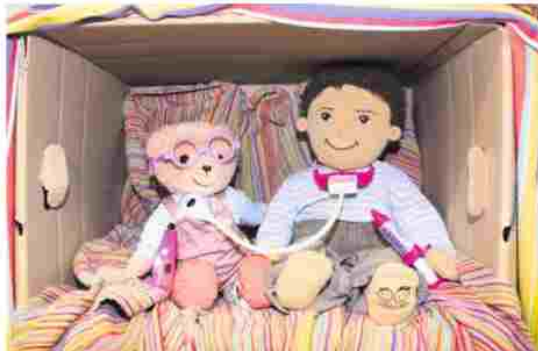
Mädchen und Jungen bauen gern Höhlen. Manche Kinder wollen darin ungestört ihre Körper erkunden. Einige Eltern befürchten Übergriffe. Pädagogen empfehlen, die Neugier der Kinder im Rahmen von Regeln zuzulassen.

Elmshorn (Hf) In der Silvesternacht ist ein 28-Jähriger in Elmshorns Innenstadt von zwei Männern schwer verletzt worden. Die Polizei hat jetzt zwei tatverdächtige festgenommen. SEITE 5