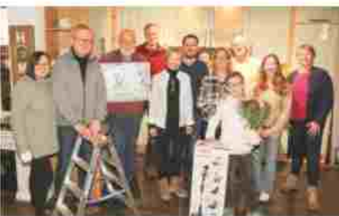
Die Gewinner der Hauptpreise zusammen mit der Firmenleitung.

Barmstedt (rs) Seit über 30 Jahren ist die Weihnachts-tombola von Küchen Johannsen fester Bestandteil der Barmstedter Adventszeit. Etwa 1750 Lose wurden diesmal verkauft. Die hochwertigen Preise der Tombola wie eine Küchenecke, ein Staubsauger, eine Mikrowelle, eine Leiter und vieles mehr sammelt die Familie Johannsen jedesmal bei Partnern der