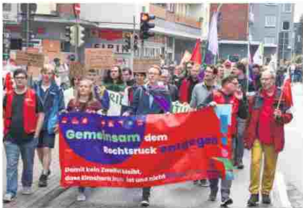
Das Bündnis für Demokratie Elmschorn organisierte bereits 2024 eine Demo gegen Rechtsextremismus. Die Aktiven wollen zeigen, dass die Mehrheit der Gesellschaft bereit ist, sich den Gefahren entgegenzustellen.

„Die Zustimmung zu rechtsextremen Parteien, gerade in der sensiblen Phase vor den Bundestagswahlen, ist alarmierend“, warnt das Bündnis. Ausländerfeindlichkeit, Rassismus und faschistisches Gedankengut nähmen zu.