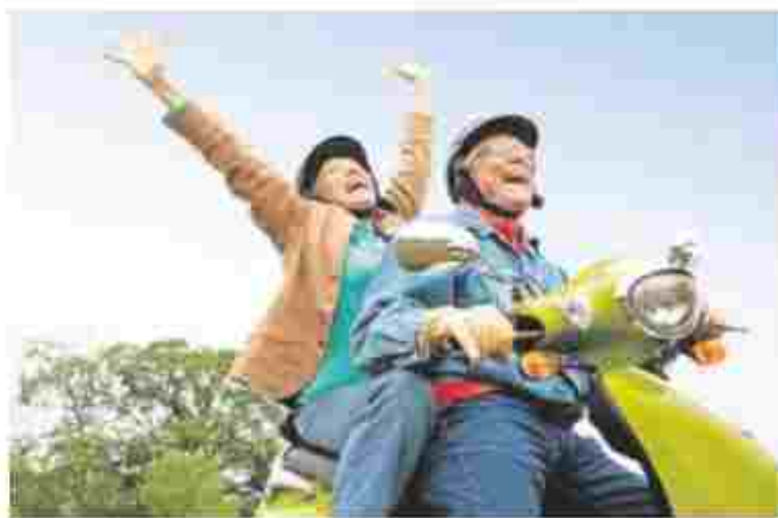
Viele ltere Menschen fhlen sich heute jnger als sie nach Lebensjahren sind.