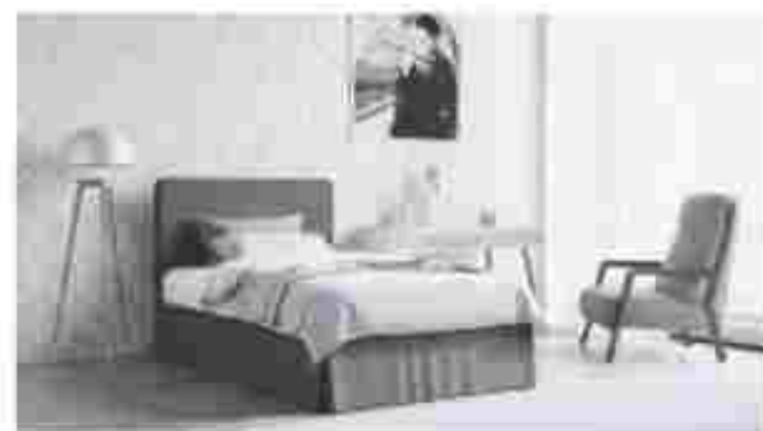
Das richtige Bett erleichtert das Aufstehen – und sorgt fr angenehmen Schlaf.

Angesichts dieser Lebenserwartung macht eine allzu bescheidene Lebensfhrung auch im fortgeschrittenen Alter also keinen Sinn. Im Bereich des Bettes und der Bettausstattung ist bei guter Gesundheitsschdlich. Vor allem durchgelegene Matratzen oder Zudecken mit verklumter Fllung knnen dann schnell unangenehme Auswirkungen haben. Statt der im Alter besonders wichtigen Erholung sind dann nmlich oftmals eine Erkltung und verstrkte Rcken- oder Gelenkschmerzen die Folge. Eine zunehmende Zahl lterer Menschen hat dies mittlerweile erkannt und erneuert